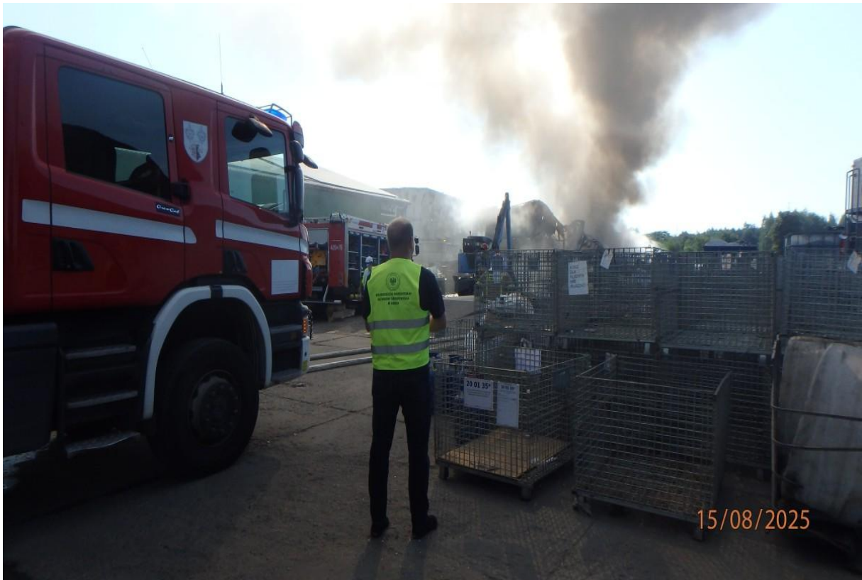
Fot.4. Pożar zakładu przetwarzania zużytego sprzętu elektrycznego i elektronicznego w Bogumiłowie, gm. Kleszczów (15.08.2025 r.)