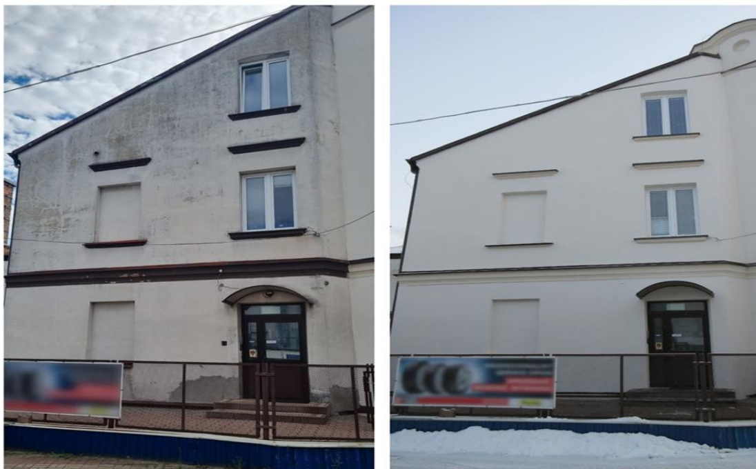
Fot. 9. Elewacja budynku siedziby WIOŚ w Łodzi Delegatury w Sieradzu „przed i po” remoncie