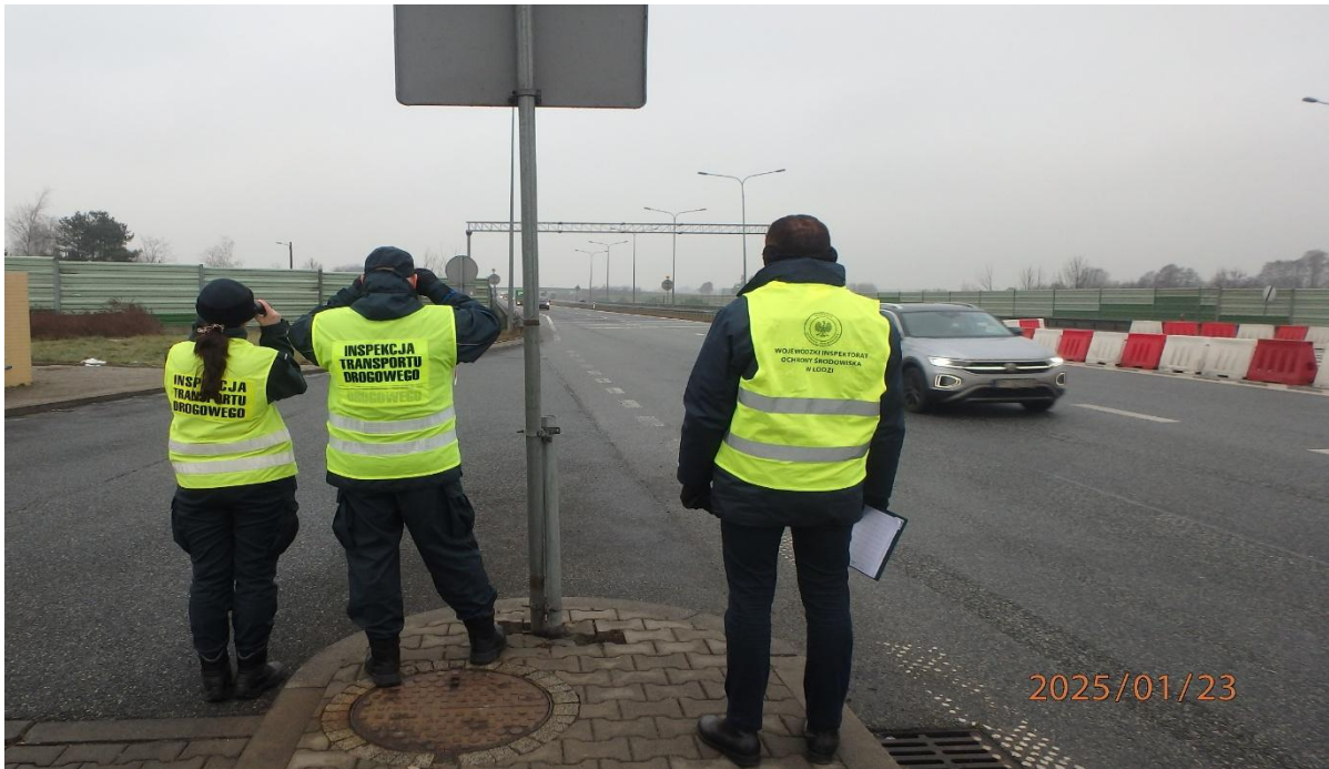
Fot.2. Wspólne działania WIOŚ w Łodzi oraz ITD w ramach drogowych akcji kontrolnych