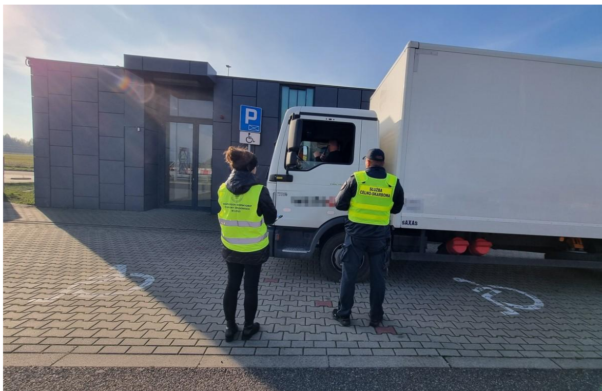
Fot.1. Wspólne działania WIOŚ w Łodzi oraz KAS w ramach drogowych akcji kontrolnych

Ponadto, 9 grudnia 2025 r. inspektorzy WIOŚ w Łodzi razem z Policją wzięli udział w akcji „Odpady”, podczas której skontrolowano 4 pojazdy, z których 2 przewoziły odpady. Nie ujawniono nielegalnych transportów odpadów.