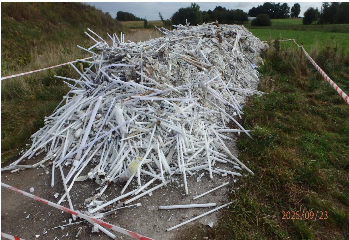
Fot. 5. Ujawnienie porzuconych odpadów w postaci świetlówek na terenie gm. Stryków w okolicy autostrady A1 (23.09.2025 r.)