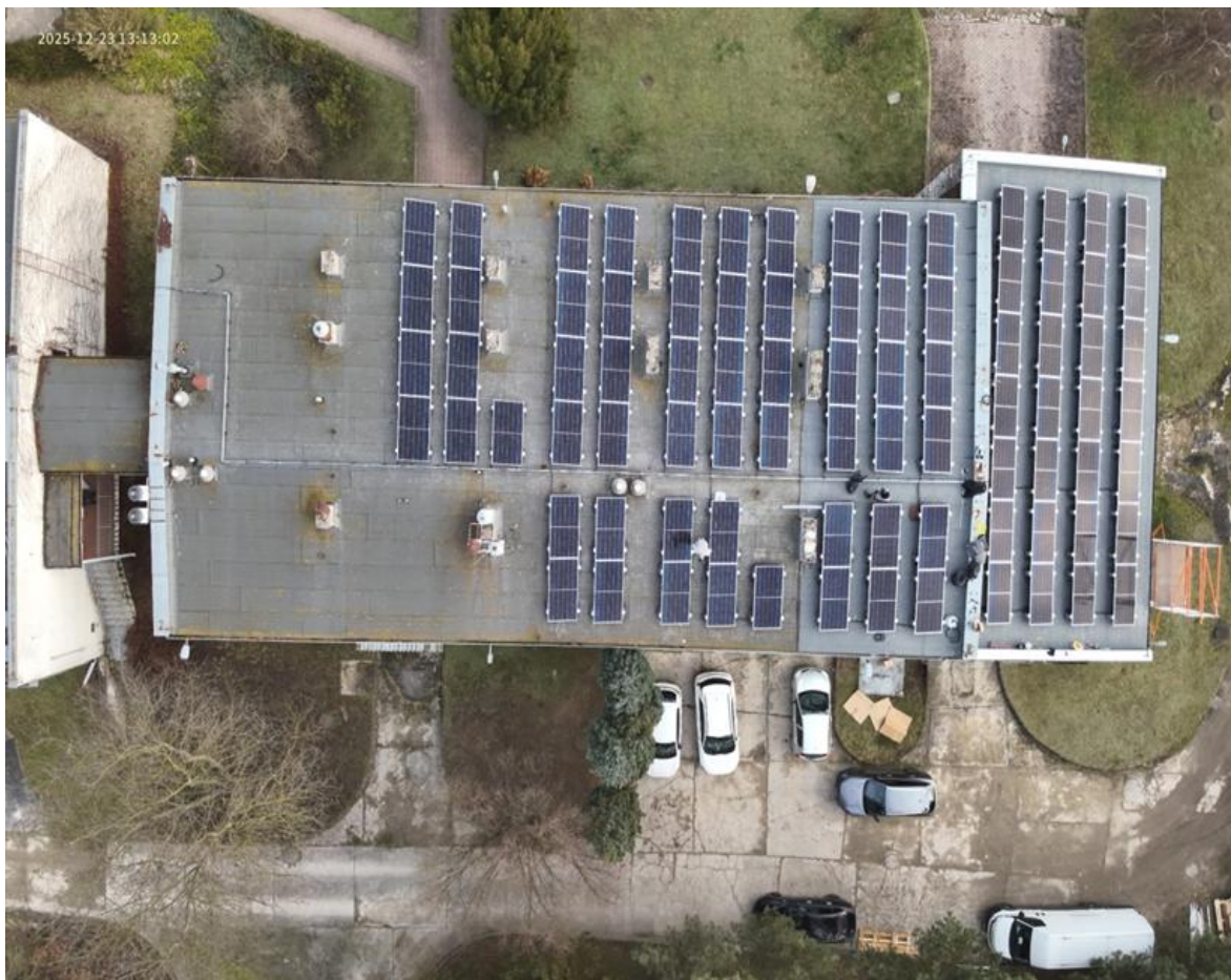
Fot. 7. Instalacja fotowoltaiczna na dachu budynku Delegatury w Piotrkowie Trybunalskim

3. Zakup i montaż instalacji fotowoltaicznej w siedzibie WIOŚ w Łodzi Delegatury w Sieradzu. Realizacja zadania pozwoli na uzyskanie oszczędności w zakresie zużycia energii elektrycznej z sieci.