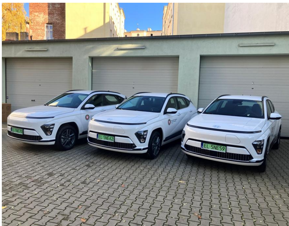
Fot. 6. Nowe samochody elektryczne