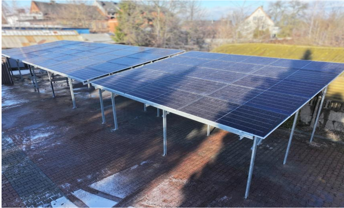
Fot. 8. Instalacja fotowoltaiczna w siedzibie WIOŚ w Łodzi Delegaturze w Sieradzu

4. II etap remontu elewacji obejmujący wschodnią i zachodnią część (sąsiadującą bezpośrednio z wieżą) budynku siedziby GIOŚ i WIOŚ w Łodzi Delegatura w Sieradzu