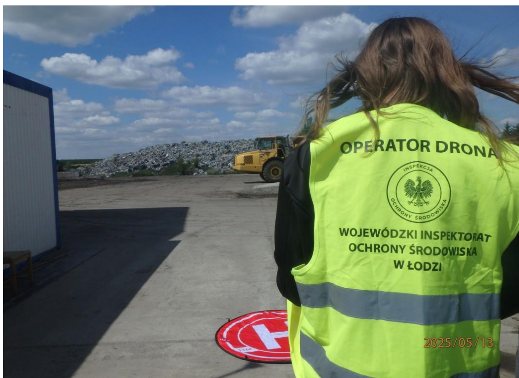
Fot. 3. Czynności w związku nieprawidłowościami związanymi z rekultywacją składowiska odpadów innych niż niebezpieczne i obojętne w Brzezinach (19.05.2025 r.)