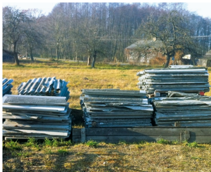
Fot. VII.6 Odpady azbestowe, przeznaczone do unieszkodliwienia w ramach zadania realizowanego przez gminę Głuchów

W 2011 r. udało się unieszkodliwić azbest w ilości 189 Mg, w 2012 r. unieszkodliwieniu będzie poddany azbest z pozostałych terenów w łącznej szacowanej wielkości 1.152 Mg.