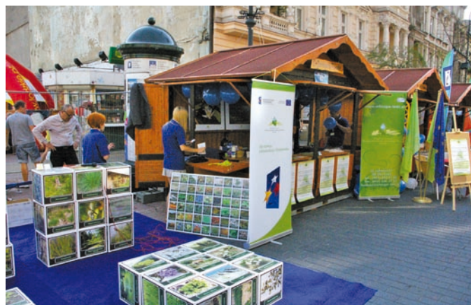
Fot. VII.18 Stoisko Funduszu na Jarmarku Wojewódzkim na ul. Piotrkowskiej w Łodzi

W 2011 r. w ramach działań promocyjnych założono profil Funduszu na portalu społecznościowym Facebook, gdzie zostały zamieszczone podstawowe i niezbędne informacje dotyczące Funduszu.