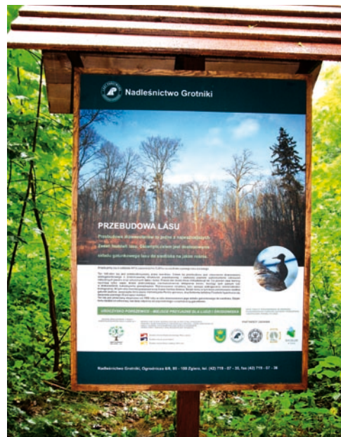
Fot. VII.12 Element ścieżki edukacyjnej w Nadleśnictwie Grotniki

W tej grupie zadań Fundusz zawarł również 21 umów na utworzenie ogródków dydaktycznych przy szkołach i przedszkolach na terenie województwa łódzkiego.