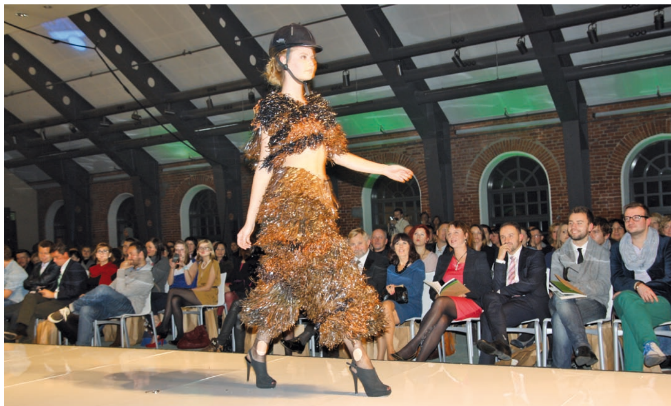
Fot. VII.13 Gala finałowa RE-ACT Fashion