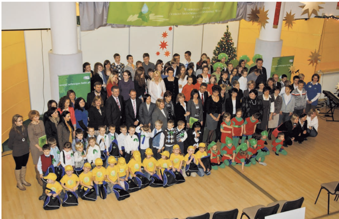
Fot. VII.16 Na zdjęciach powyżej podsumowanie konkursu EKOBELFRY 2011 i wręczenie nagrody laureatom I miejsca w Publicznym Gimnazjum im. M. Kopernika w Burzeninie

W 2011 r. Fundusz dokonał także wypłaty nagród na rzecz laureatów XI edycji konkursu „Przeglądu Komunalnego” o Puchar Recyklingu. Fundusz wypłacił również nagrody laureatom XII Narodowego Konkursu Ekologicznego „Przyjaźni środowisku”.