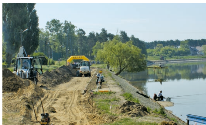
Fot. VII.5 Prace przy zbiorniku retencyjnym w Strykowie