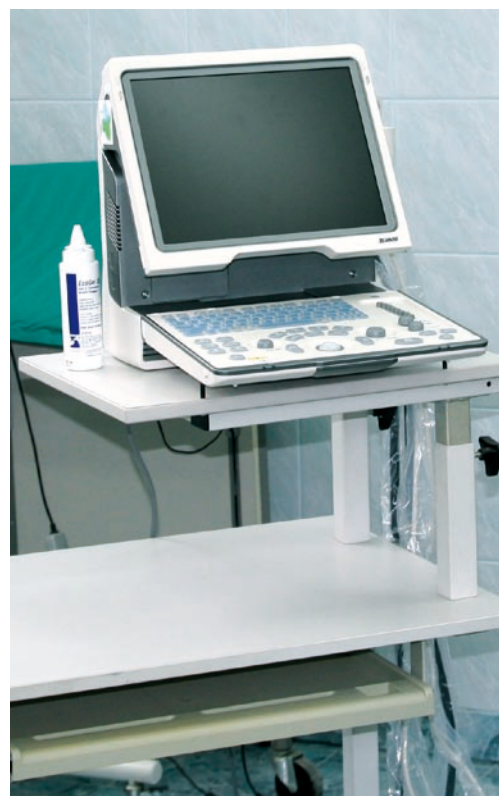
Fot. VII.8 Podpisanie umowy z miastem Łódź na wyposażenie laboratorium lecznicy dla zwierząt w Miejskim Ogrodzie Zoologicznym oraz zakupienie w ramach umowy specjalistycznego sprzętu medycznego