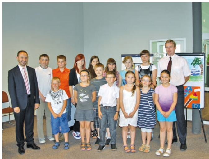
Fot. VII.17 Laureaci konkursu plastycznego, organizowanego przez Fundusz: Fundusze Unii Europejskiej pokolorują naszą gminę – w poszukiwaniu śladów inwestycji ekologicznych UE