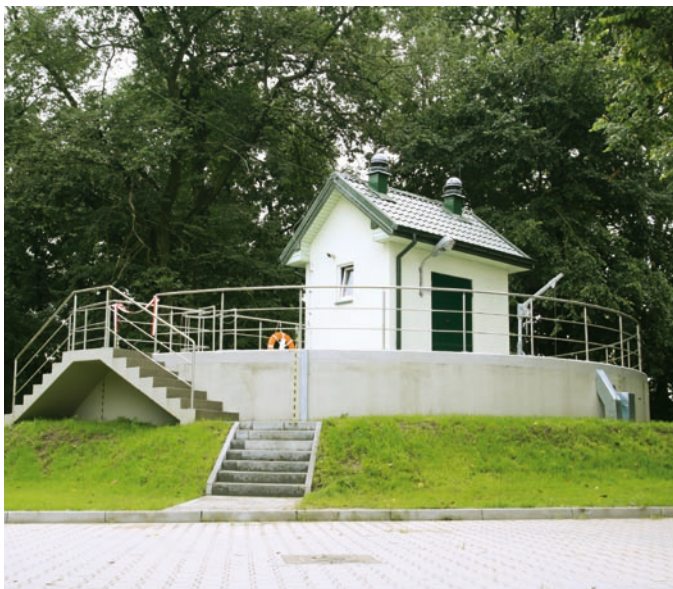
Fot. VII.3 Oczyszczalnia ścieków w gminie Nowy Kawęczyn po przebudowie

Fundusz dofinansował budowę, modernizację i rozbudowę małych oczyszczalni ścieków o przepustowości do 250 m 3 /dobę w gminach: Sadkowice, Nowy Kawęczyn i Wielgomłyny oraz na terenie Domu Opieki „Zacisze” w Łąznowskiej Woli (gm. Rokiciny), a także o przepustowości powyżej 250 m 3 /dobę w gminie Wola Krzysztoporska. Wybudowane oczyszczalnie ścieków umożliwią redukcję BZT 5 o około 391 Mg/rok.