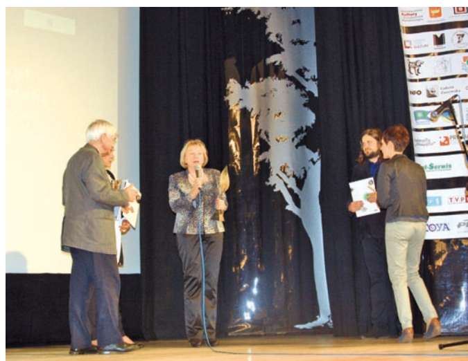
Fot. VII.11 Otwarcie MFFP im. W. Puchalskiego

Ciekawą imprezą, dofinansowaną po raz kolejny ze środków Funduszu, była gala finałowa III edycji Re-Act Fashion, podczas której odbył się pokaz mody dwudziestu finałowych kolekcji z materiałów wtórnych. Projektanci zaprezentowali stroje zrobione między innymi z wykładziny PCV, taśmy magnetowideofonowej, skrawków sztucznej skóry, używanej jako przemysłowa tapicerka, papieru i tektury.