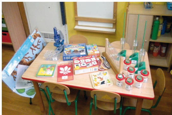
Fot. VII.9 Pomoce dydaktyczne zakupione do Przedszkola Miejskiego nr 15 w Pabianicach

Fundusz zawarł 104 umowy dotacji między, innymi na zakup tablic informacyjno-dydaktycznych, nagrody w konkursach ekologicznych oraz na zakup pomocy dydaktycznych do prowadzenia zajęć edukacyjnych. Zadania realizowane były przez przedszkola, szkoły wszystkich szczebli nauczania, jednostki samorządu terytorialnego, ośrodki kultury, parki krajobrazowe, nadleśnictwa, spółdzielnie oraz organizacje pozarządowe, m.in. Związek Harcerstwa Polskiego, Towarzystwo Przyjaciół Dzieci, Ligę Ochrony Przyrody.