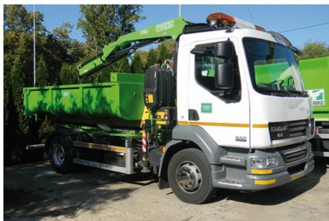
Fot. VII.7 Samochód ciężarowy do przewozu odpadów oraz kontenery zakupione w ramach zadania realizowanego przez Kurię Metropolitalną Łódzką