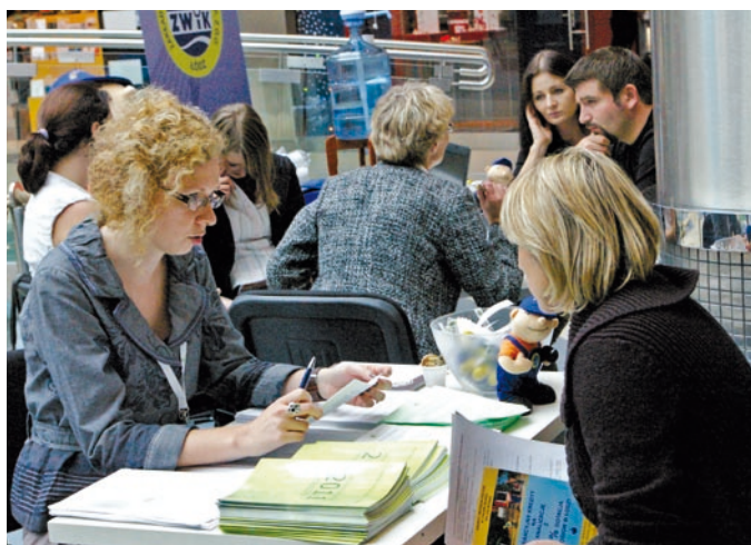
Fot. VII.15 Punkt konsultacyjny Funduszu dla osób fizycznych w jednej z łódzkich galerii handlowych

W 2011 r. została wprowadzona nowa forma dofinansowania, przeznaczona dla zadań realizowanych przez osoby fizyczne, tj. dotacja w formie częściowej spłaty kapitałów kredytów bankowych.