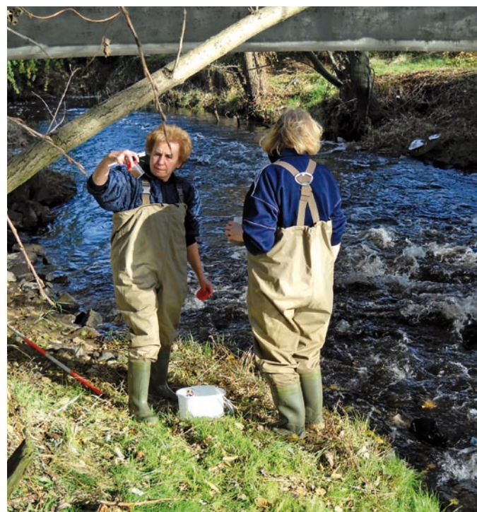
Fot. VII.1 Pobieranie fitobentosu

Struktura organizacyjna, baza laboratoryjna (wyposażenie pomiarowe i badawcze oraz pomieszczenia) i zarządzanie zachowują we wdrożonym systemie zarządzania jakością usług badawczych dla klientów wewnętrznych i zewnętrznych.