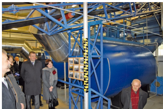
Fot. VII.2 Kotłownia Z-10, przebudowana w ramach inwestycji realizowanej przez spółkę Zakład Energetyki Ciepłej Sp. z o.o. w Łowiczu

Wsparcie finansowe dla Zakładu Energetyki Ciepłej Sp. z o.o. w Łowiczu przyznano na realizację zadania pn. „Przebudowa kotłowni Z-10 i budowa węzłów ciepłych na osiedlu Marii Konopnickiej”. W ramach prac m.in. zamontowano 10 sztuk węzłów ciepłych.