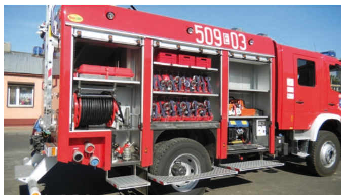
Fot. VII.14 Samochód pożarniczy zakupiony dla OSP w Uniejowie (fot. archiwum Funduszu)