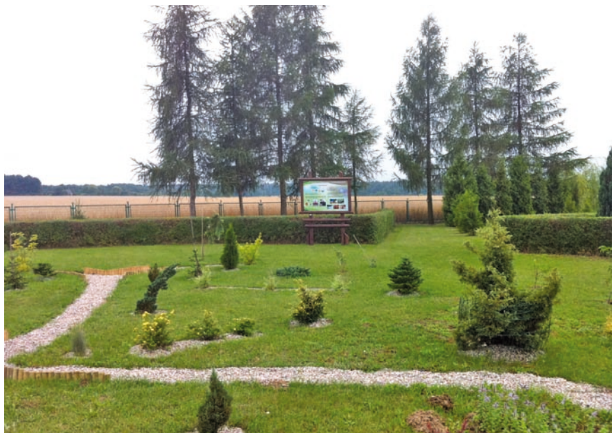
Fot. VII.10 Ogródek przy Szkole Podstawowej w Dąbrowie Wielkiej