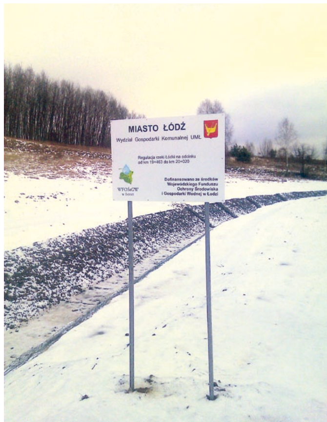
Fot. VII.4 Koryto rzeki Łódki po regulacji

Fundusz podpisał umowy na zadania: „Renowacja linii brzegowej zbiornika retencyjnego w Strykowie” realizowane przez gminę Stryków, „Budowa zbiornika retencyjnego staw Wasiaka w Łodzi” realizowane przez miasto Łódź oraz „Utrzymanie i konserwacja urządzeń melioracji wodnych podstawowych (budowle piętrzące, zbiorniki, wały przeciwpowodziowe)”, realizowane przez województwo łódzkie. W ramach zadania realizowanego przez województwo łódzkie wykonana zostanie konserwacja i utrzymanie 133 budowli piętrzących, konserwacja 6 zbiorników retencyjnych oraz ok. 124 km wałów przeciwpowodziowych.