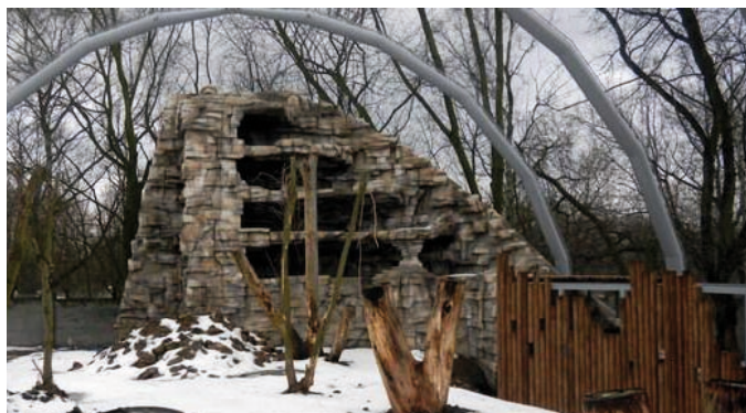
Fot. VIII.5 Budowa woliery dla sępów w Łódzkim Ogrodzie Zoologicznym