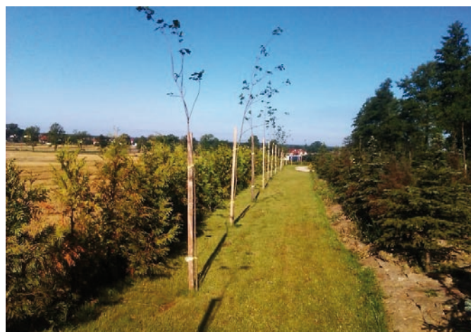
Fot. VII.4 Nasadzenia drzew i krzewów w parafii rzym.-kat. w Górcie Pabianickiej, gmina Pabianice

Dzięki środkom finansowym funduszu możliwe było powiększenie terenów zieleni poprzez nasadzenie 42.730 drzew, krzewów, roślin na obszarach gminnych i miejskich, parków zabytkowych, parków przykościelnych, na terenach przyszkolnych oraz należących do spółdzielni mieszkaniowych bądź podmiotów opieki zdrowotnej, a także dróg powiatowych.