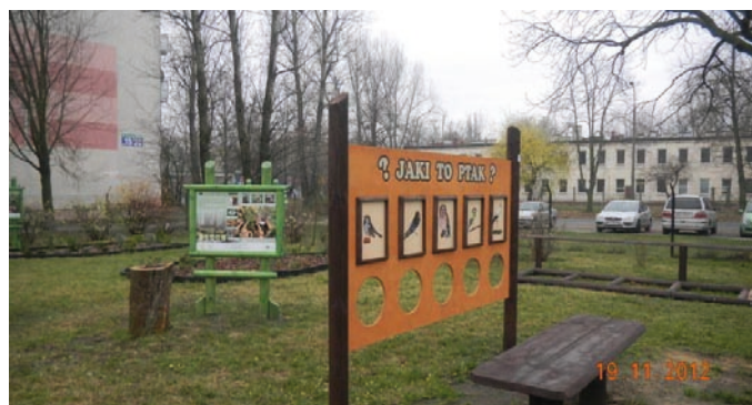
Fot. VIII.6 Ścieżka edukacyjno-przyrodnicza „Witaj przyrodzie” w Przedszkolu Miejskim nr 120 w Łodzi

Ogromnym zainteresowaniem cieszył się organizowany już po raz drugi konkurs na „Utworzenie ogródków dydaktycznych przy szkołach i przedszkolach”. Fundusz na ten cel zawarł 29 umów na zadania polegające na zagospodarowaniu terenów przyszkolnych i przedszkolnych w celu stworzenia ogródków na potrzeby prowadzenia edukacji ekologicznej i przyrodniczej.