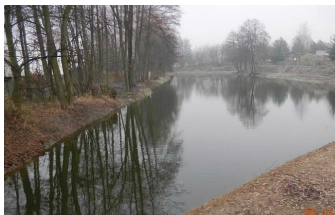
Fot. VIII.2 Zbiornik retencyjny w gminie Sadkowiec