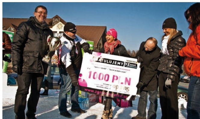
Fot. VIII.13 Wręczenie nagród uczestnikom konkursu „Zgnieć i zjedź – jazdź na byle czym” w ramach kampanii „Zgnieć butelkę” współfinansowanej przez fundusz.

Ważnym elementem działalności promocyjnej było wdrożenie i uruchomienie w 2012 r. nowej strony internetowej WFOŚiGW w Łodzi.