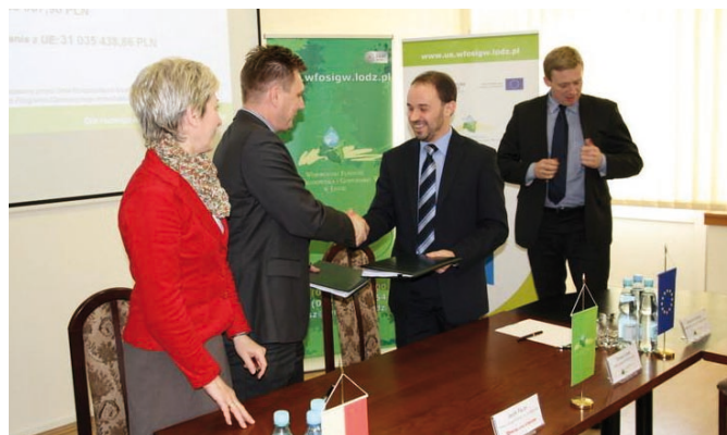
Fot. VIII.12 Podpisanie umowy z Przedsiębiorstwem Gospodarki Komunalnej Sp. z o.o. w Opocznie

23 marca 2012 roku została podpisana umowa o dofinansowanie projektu: „Budowa infrastruktury wodno-ściekowej na terenie gminy Opoczno” o wartości całkowitej prawie 63,5 mln zł.