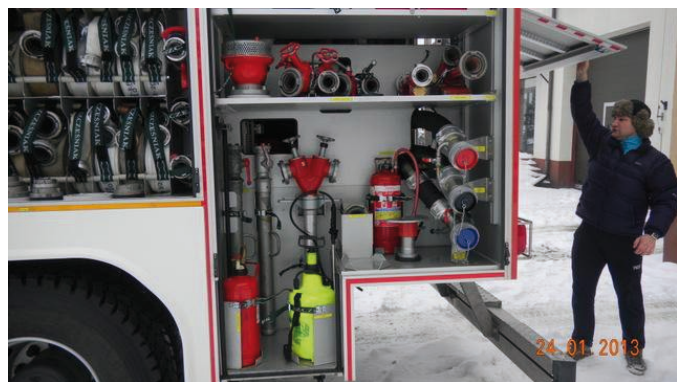
Fot. VIII.8 Wyposażenie ciężkiego samochodu ratowniczo-gaśniczego dla OSP Lgota Wielka

W ramach przekazania środków państwowym jednostkom budżetowym fundusz zawarł 3 umowy z Komendą Wojewódzką Państwowej Straży Pożarnej w Łodzi na zakup kontenera przeciwpowodziowego z motopompą, kontenera wymiennego inżynieryjno-technicznego oraz zakup sprzętu podstawowego w zakresie ratownictwa chemiczno-ekologicznego.