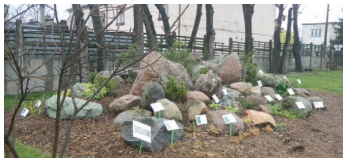
Fot. VIII.7 Ogródek dydaktyczny w Przedszkolu Miejskim nr 3 w Ozorkowie