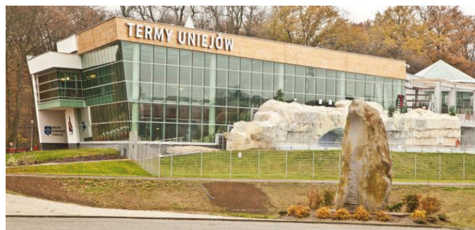
Fot. VIII.1 Budynek „Termy Uniejów”

W ramach tej grupy zadań zawarto 44 umowy, m.in. z: jednostkami samorządu terytorialnego, spółkami prawa handlowego, stowarzyszeniami, kościołami i związkami wyznaniowymi oraz z zakładem opieki zdrowotnej. Zakres rzeczowy realizowanych zadań związany z odnawialnymi źródłami energii to: wykonanie instalacji kolektorów słonecznych, pomp ciepła i wód geotermalnych do celów grzewczych, jak również przygotowania ciepłej wody użytkowej oraz wykonanie instalacji ogniw fotowoltaicznych, montaż systemu rekuperacji, a także modernizacja źródła ciepła poprzez zastosowanie kotłów na biomasę.