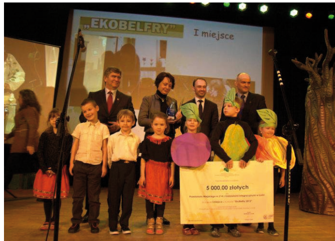
Fot. nr 11 Wręczenie nagrody laureatom konkursu „Ekobelfry”