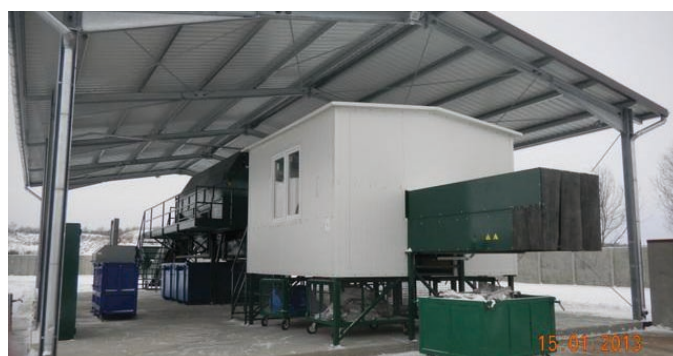
Fot. VIII.3 Linia do segregowania odpadów w Zakładzie Oczyszczania Miasta W.W.Dymek i J. Jagielski Sp.J. w Łowiczu