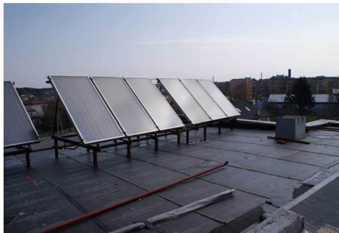
Fot. VII.1 Zastosowanie odnawialnych źródeł energii – kolektorów słonecznych dla podgrzania wody w basenie Powiatowej Pływalni w Pajęcznie

Największą inwestycją zrealizowaną w 2010 r. w zakresie wykorzystania alternatywnych źródeł energii jest inwestycja