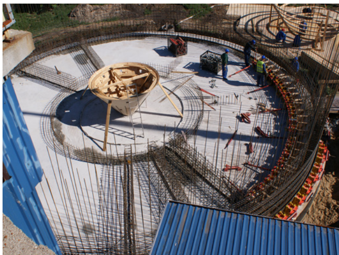
Fot. VII.2 Rozbudowa istniejącej oczyszczalni ścieków do Q=1875 m 3 /dobę w Moszczenicy – reaktor BIOGRADEX II

W ramach umów zawartych w 2010 r. Fundusz dofinansował budowę, modernizację i rozbudowę małych oczyszczalni ścieków o przepustowości do 250 m 3 /dobę w gminach: Uniejów, Poświętne, Słupia, Sadkowice, Krzyżanów (2 szt.), Kluki, Wróblew, Grabów, Rzeczycza, Kiernoza, Budziszewice oraz o przepustowości powyżej 250 m 3 /dobę w gminach: Paradyż, Rozprza, Galewice, Wolbórz, Andrespol, Sławno (2 szt.).