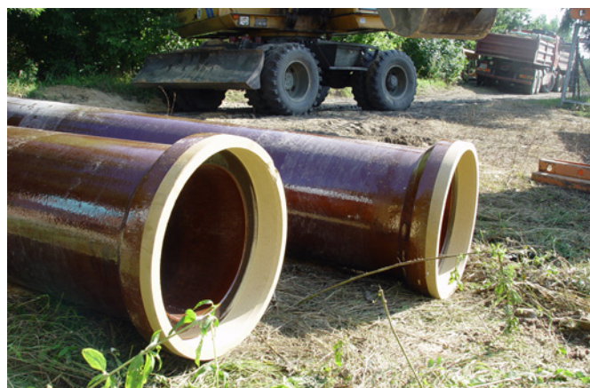
Fot. VII.3 Budowa kolektora sanitarnego w ulicy Granicznej w Ozorkowie

Projekt pn: „Gospodarka wodno-ściekowa w aglomeracji miasta Ozorków” realizowany przez Ozorkowskie Przedsiębiorstwo Komunalne sp. z o. o., obejmuje odprowadzenie na oczyszczalnię ścieków komunalnych w ilości ok. 106.142,00 m 3 /rok oraz dostarczenie mieszkańcom wody o odpowiednich parametrach jakościowych w ilości 2.049,00 m 3 /rok.