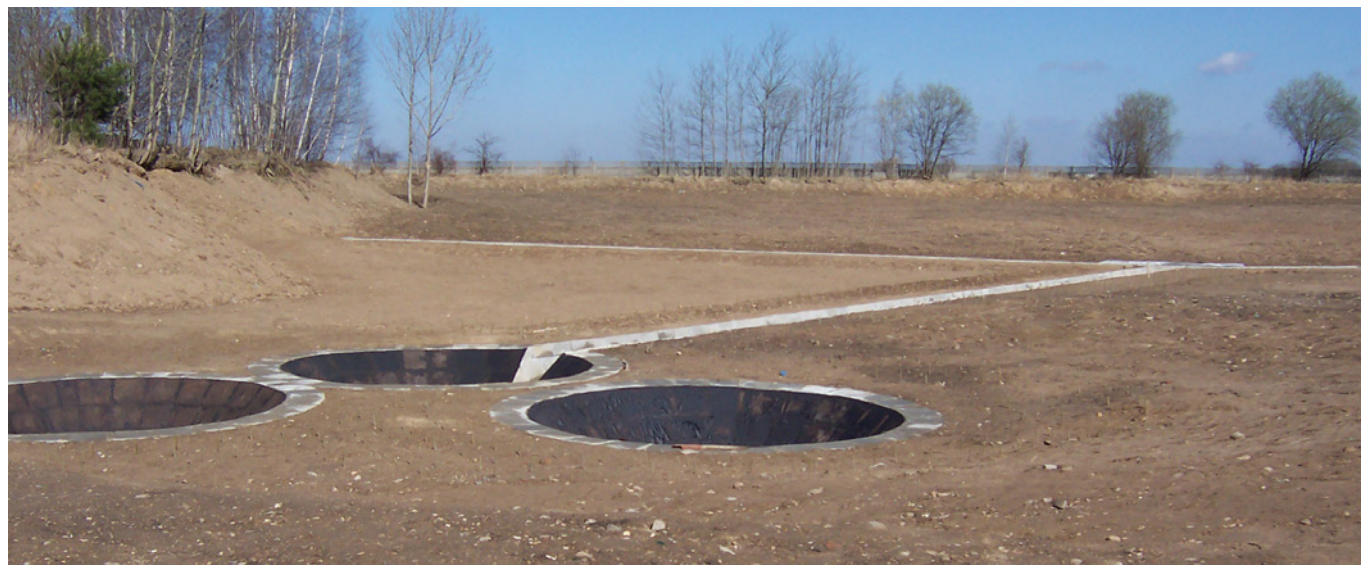
Fot. VII.4 Zamknięcie i rekultywacja składowiska odpadów w gminie Mokrsko

W ramach tej grupy zawarto 1 umowę pożyczki z Miejskim Przedsiębiorstwem Wodociągów i Kanalizacji w Zduńskiej Woli Spółka z o.o. W wyniku realizacji zadania planowane jest osiągnięcie efektu ekologicznego m.in. w postaci ograniczenia ilości powstających osadów, zmniejszenia uciążliwości oczyszczalni.