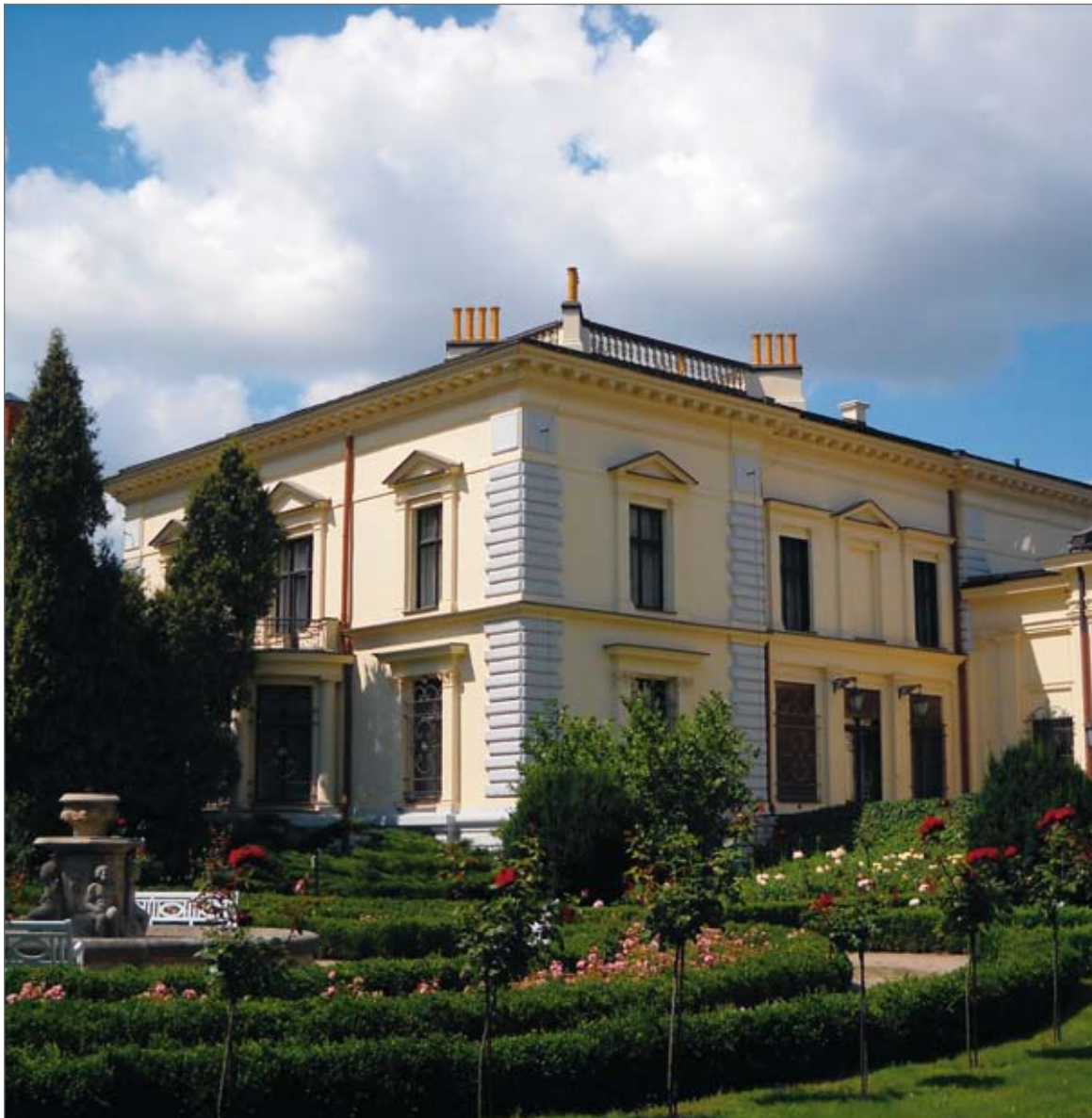
Pałac Herbsta, Łódź