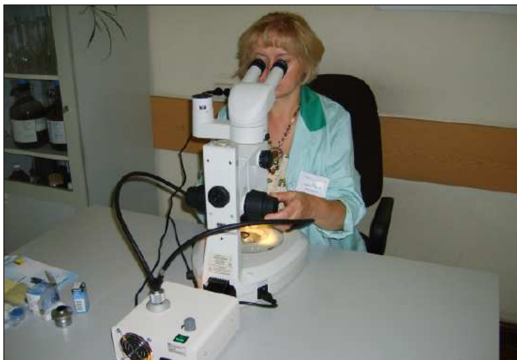
Oznaczanie makrobezkręgowców bentosowych