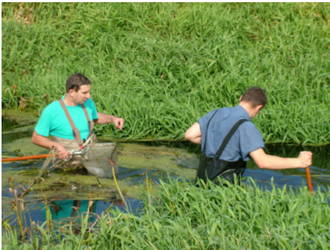
Pobór makrobezkręgowców bentosowych. Rzeka Nida w pobliżu Leszna